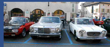
Ruote classiche tra le mura 2014